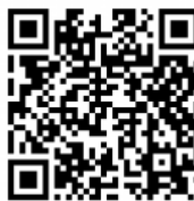
CoolWear para iOS